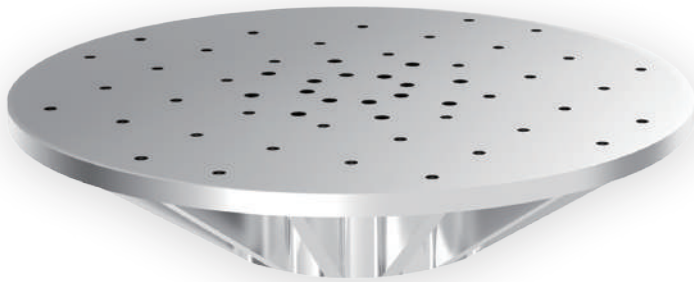
– Modal simulation diagram –